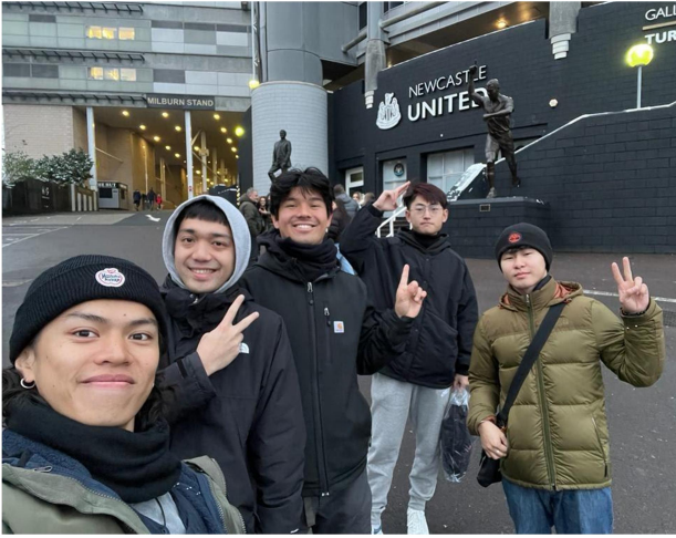
來自台灣 / 美國 / 中國 / 蒙古的同學