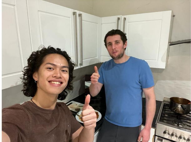
第一天在Airbnb認識的外國朋友