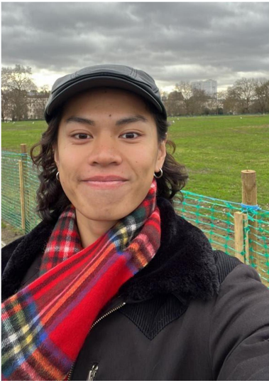
完成第一個功課後放假