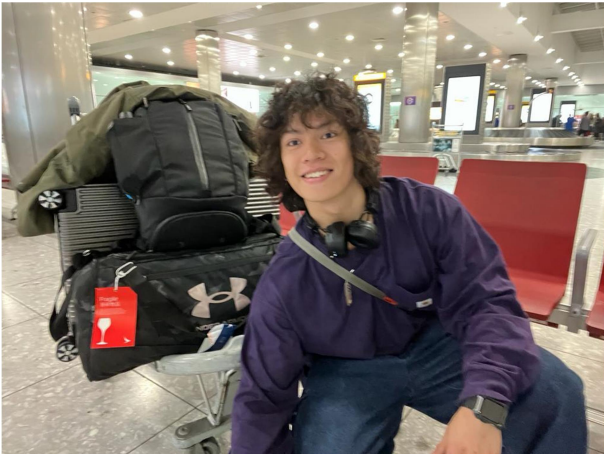
登陸英國倫敦的那天