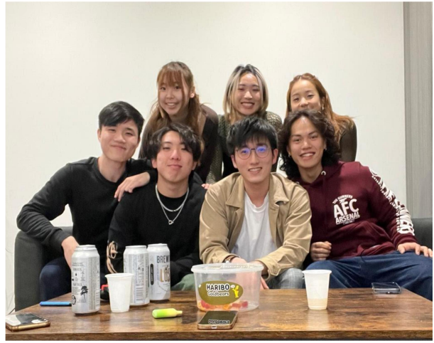
在倫敦與中學同學食飯